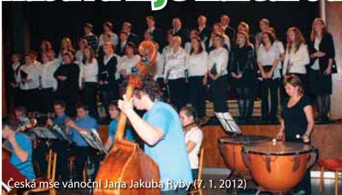
Česká mše vánoční Jana Jakuba Ryby (7. 1. 2012)