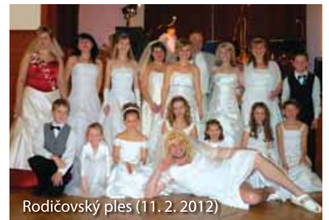
Rodičovský ples (11. 2. 2012)