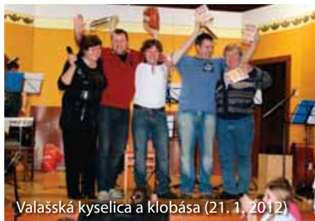
Valašská kyselica a klobása (21. 1. 2012)