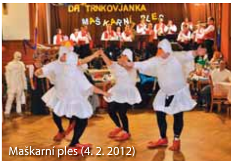
Maškarní ples (4. 2. 2012)