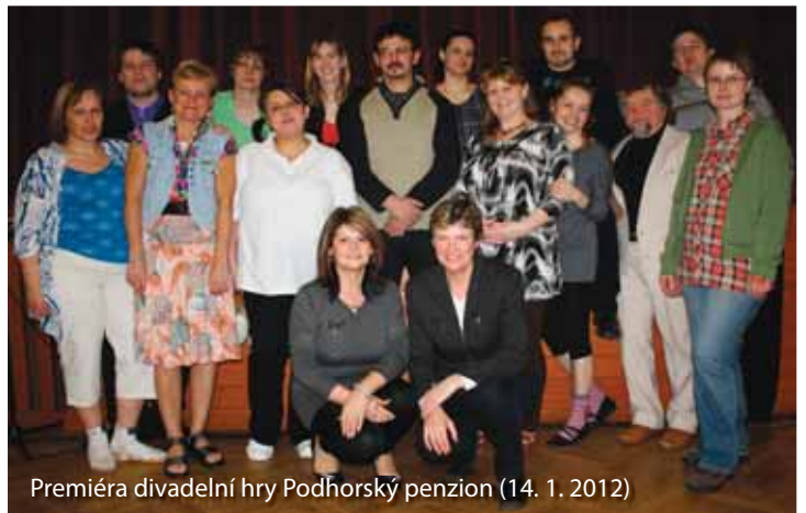
Premiéra divadelní hry Podhorský penzion (14. 1. 2012)